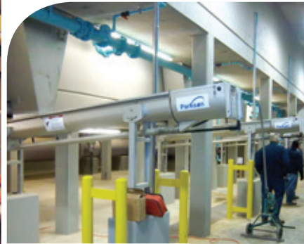
Gran capacidad de transporte